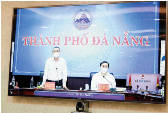
Bí thư Thành ủy Đà Nẵng Trương Quang Nghĩa phát biểu tại điểm cầu trực tuyến TP. Đà Nẵng