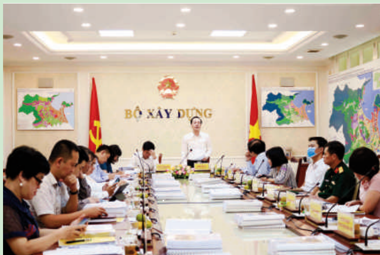
Bộ trưởng Phạm Hồng Hà - Chủ tịch Hội đồng chủ trì hội nghị