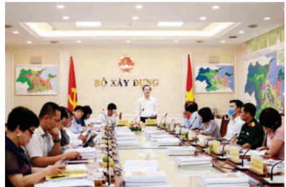
Bộ trưởng Phạm Hồng Hà - Chủ tịch Hội đồng chủ trì hội nghị

TP. Đà Nẵng được quy hoạch với tính chất, chức năng là đô thị loại I trực thuộc Trung ương, trung tâm kinh tế lớn của quốc gia về du lịch, công nghiệp, thương mại, dịch vụ tài chính ngân hàng, có vị trí quan trọng trong chiến lược phát triển đô thị quốc gia; là trung tâm văn hóa thể dục thể thao, giáo dục đào tạo, trung tâm