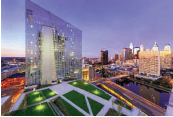
Cira Green trên nóc gara 11 tầng, liền kề tòa nhà 34 tầng (Philadelphia, Mỹ)

Bài viết sẽ đề cập tới ba dự án vườn được xem như những hiện tượng mới trong lĩnh vực thiết kế cảnh quan hiện đại. Các dự án được thực hiện tại những địa điểm khác nhau, với điều kiện khác nhau, song đều chung nhiệm vụ mục tiêu là thống nhất và hài hòa các yếu tố thiên nhiên với kiến trúc hiện đại.