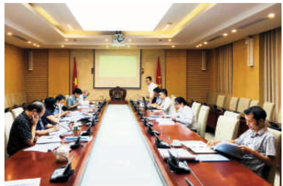
Toàn cảnh họp Hội đồng nghiệm thu

Đánh giá kết quả thực hiện đề tài, các thành viên Hội đồng cho rằng, báo cáo đề tài được