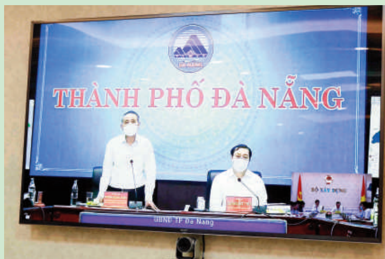
Bí thư Thành ủy Đà Nẵng Trương Quang Nghĩa phát biểu tại điểm cầu trực tuyến TP. Đà Nẵng