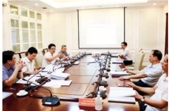
Toàn cảnh cuộc họp

Nội dung Báo cáo tổng kết đề tài bao gồm các nội dung: Tổng quan chung; tình hình nghiên cứu và sử dụng sơn bảo vệ bê tông và bê tông cốt thép trong, ngoài nước; các phương pháp chống ăn mòn; công nghệ sản xuất sơn;