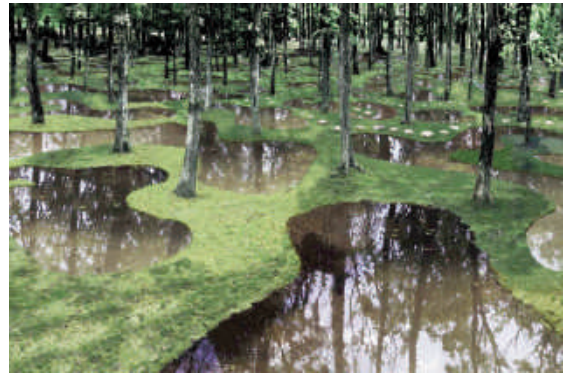
Water Garden tại Nasu (Nhật Bản)

Water Garden là một cấu trúc kết hợp trong đó các yếu tố thiên nhiên và yếu tố nhân tạo của một khu vườn. Chính xác hơn đây là khu rừng với rất nhiều cây và một mê cung ao đầm độc đáo. Kiến trúc sư Junya Ishigami đã thiết kế