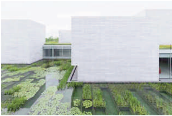
Hệ sinh thái nước bên trong Bảo tàng Nghệ thuật đương đại Glenstone

Khu công viên chiếm trọn 120 ha đất vùng ngoại ô Maryland, cách Thủ đô Washington khoảng 25 km, là tác phẩm có sự tham gia của kiến trúc sư cảnh quan Adam Greenspan. Từ 2013 - 2018, hơn 7000 cây đã được đưa đến trồng trong công viên, cùng hàng ngàn bụi cây, khóm thực vật, các giống cỏ một năm và lâu năm, các loài hoa. Cây trồng trong công viên chủ yếu là các loài thực vật địa phương dễ thích nghi với khí hậu khu vực. Công viên bao gồm các lối đi bộ, đường mòn, các con suối nhỏ, đồng cỏ, rừng cây và khu vực dành để trưng bày các tác phẩm điêu khắc. Trên đồng cỏ bao quanh tổ hợp bảo tàng mọc các loài cỏ dại, hoa đồng nội, góp phần duy trì hệ sinh thái cân bằng.