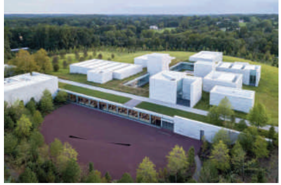
Khu Bảo tàng Nghệ thuật đương đại tại Glenstone (Mỹ)

Mái xanh có diện tích 1500m 2 , có hệ thống tích nước mưa và liên tục cấp nước cho thực vật được trồng. Các thảm cỏ xanh mượt được thiết kế ở nhiều mức khác nhau, tạo những diện tích bổ sung để tổ chức các sự kiện như hòa nhạc, chiếu phim. Cira Green cũng là địa điểm ưa thích để tổ chức các lễ hội, các buổi gặp mặt truyền thống giữa các câu lạc bộ thể thao, các tổ chức chính trị, do có một tầm nhìn lý tưởng – đường ray xe