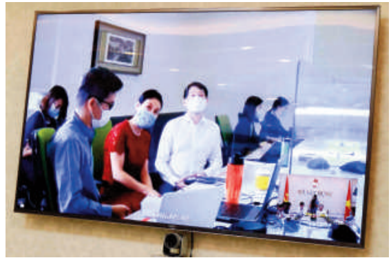
Đơn vị tư vấn tham dự hội nghị tại điểm cầu trực tuyến Singapore

quốc tế; thành phố cảng biển; đô thị biển quốc tế với vị trí hạt nhân của chuỗi đô thị và cực tăng trưởng của vùng kinh tế trọng điểm miền Trung - Tây Nguyên; thành phố đô thị sinh thái, hiện đại và thông minh, đáng sống; đảm bảo vững chắc quốc phòng an ninh và chủ quyền biển đảo.