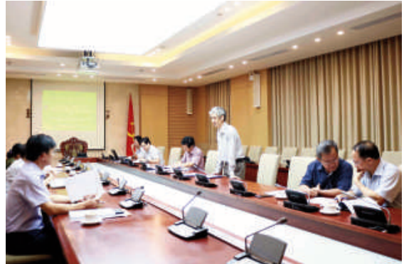
Toàn cảnh cuộc họp

TCVN “Kính xây dựng - Kính an ninh - Phân