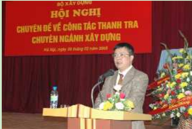
Đ/c Đinh Tiến Dũng - Thứ trưởng Bộ Xây dựng phát biểu tại Hội nghị