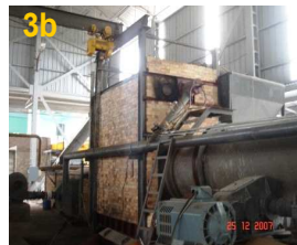
Hình ảnh công nghệ và sản phẩm tại Nhà máy Xử lý Chất thải Sơn Tây