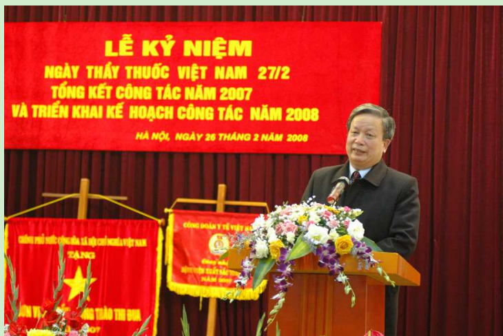
Đ/c Nguyễn Hồng Quân - Ủy viên TƯ Đảng, Bộ trưởng Bộ Xây dựng phát biểu tại buổi Lễ